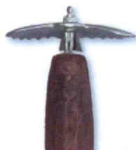
Lilienthal-Ehrenpreis Gestaltet von Kerstin Becker, Bildhauerin